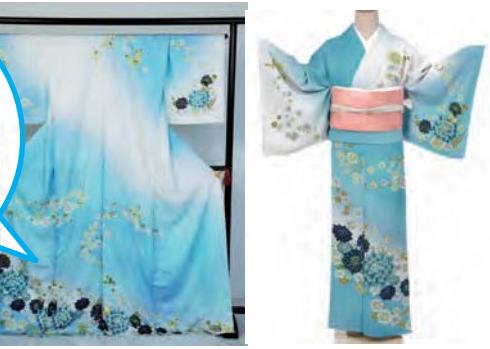
T32_蝶と花タブルー オレンジ/ピンク 3色展開