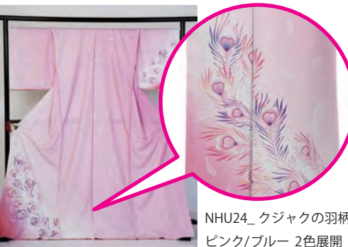
NHU24_クジャクの羽柄 ピンク/ブルー 2色展開