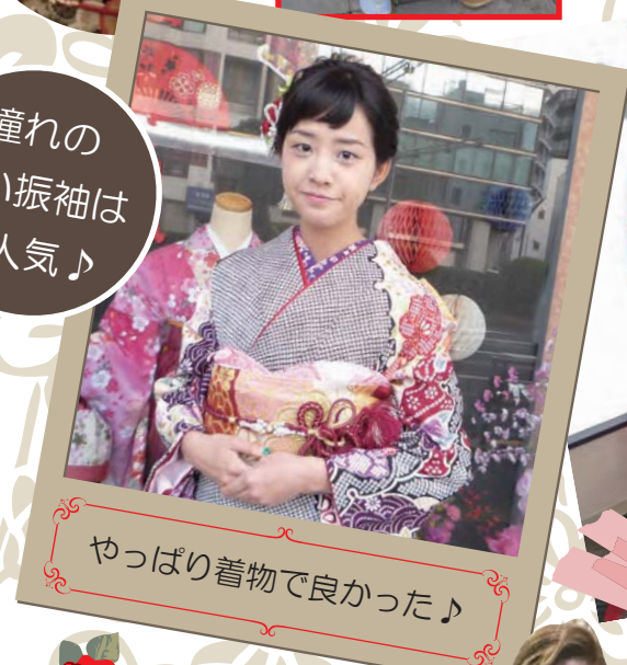
やっぱり着物で良かった♪