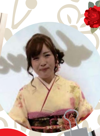
みんなで着物を着るって楽しいね♪