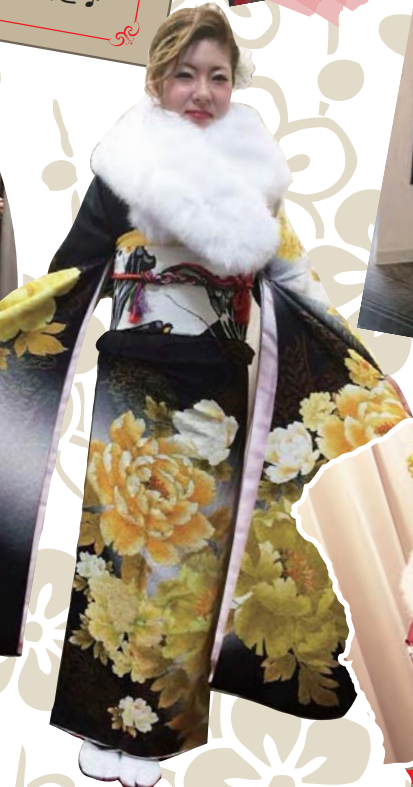
黄色と黒のコントラストがお似合いです♪