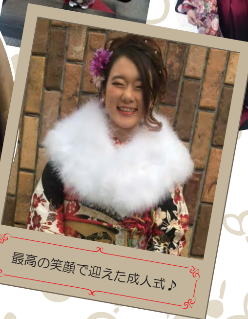
最高の笑顔で迎えた成人式♪