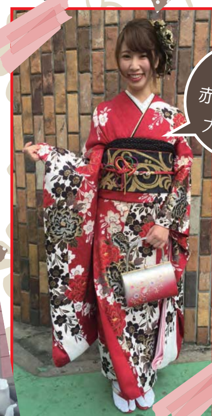
憧れの赤い振袖は大人気♪