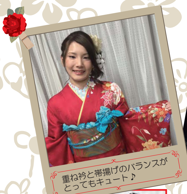
重ね衿と帯揚げのバランスがとってもキュート♪